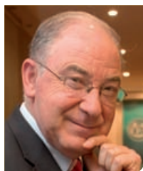
Serafín Málaga Presidente de la Asociación Española de Pediatría